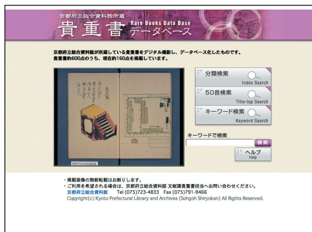
▲京都府立総合資料館「貴重書データベース」